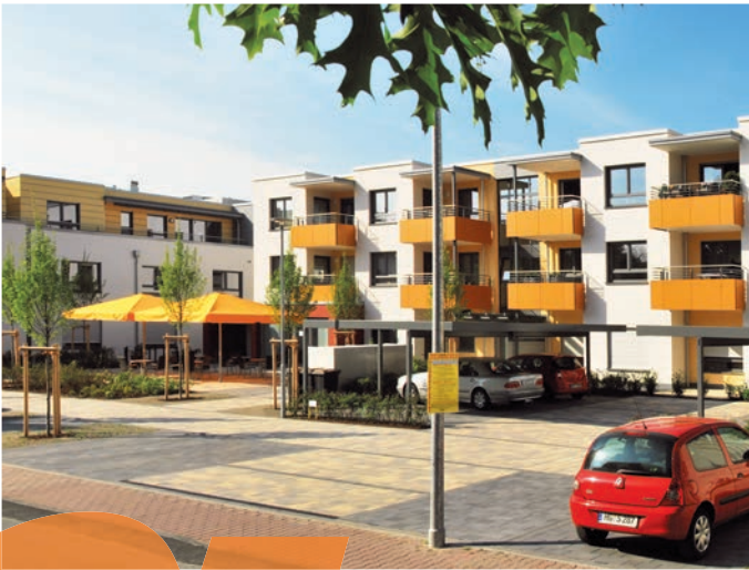
Unsere Einrichtung AN DER WIESENAU bietet ein Zuhause zum Wohlfühlen.