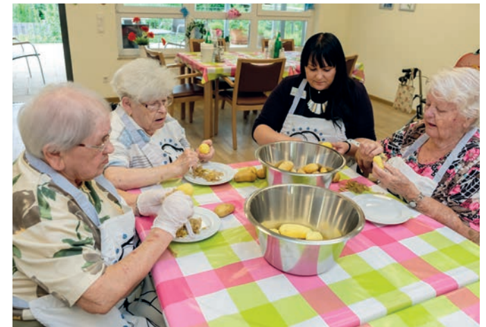
Gemeinsame Aktivitäten werden gepflegt und gefördert.