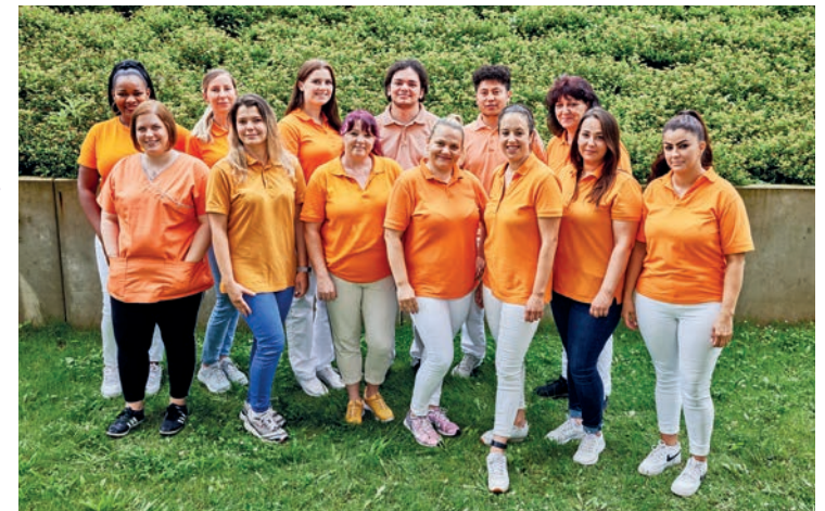
Das Team von avendi mobil ist für Sie im Raum Mannheim unterwegs.

„WIR ARBEITEN MIT HERZ UND SIE STEHEN IM MITTELPUNKT.“