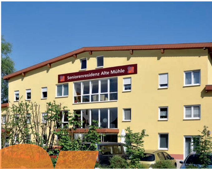
Die ALTE MÜHLE bietet ein Zuhause zum Wohlfühlen.