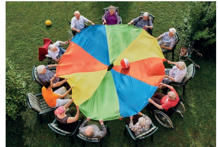
Aktivierende Aktionen machen Spaß und halten agil.

Neben der vollstationären Pflege gibt es in der ALTEN MÜHLE 15 Senioren-Service-Wohnungen. Deren Bewohner werden, wenn gewünscht, von unserem ambulanten Pflegedienst avendi mobil besucht.