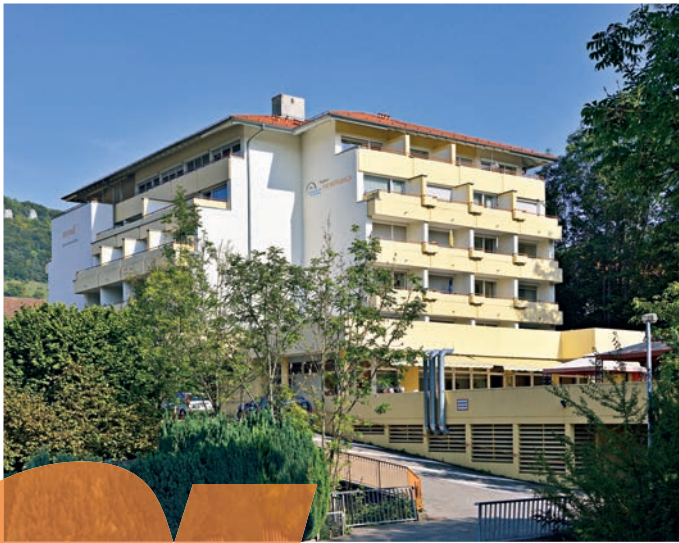
Der Pflegeheim AM MÜHLBACH bietet ein Zuhause zum Wohlfühlen.